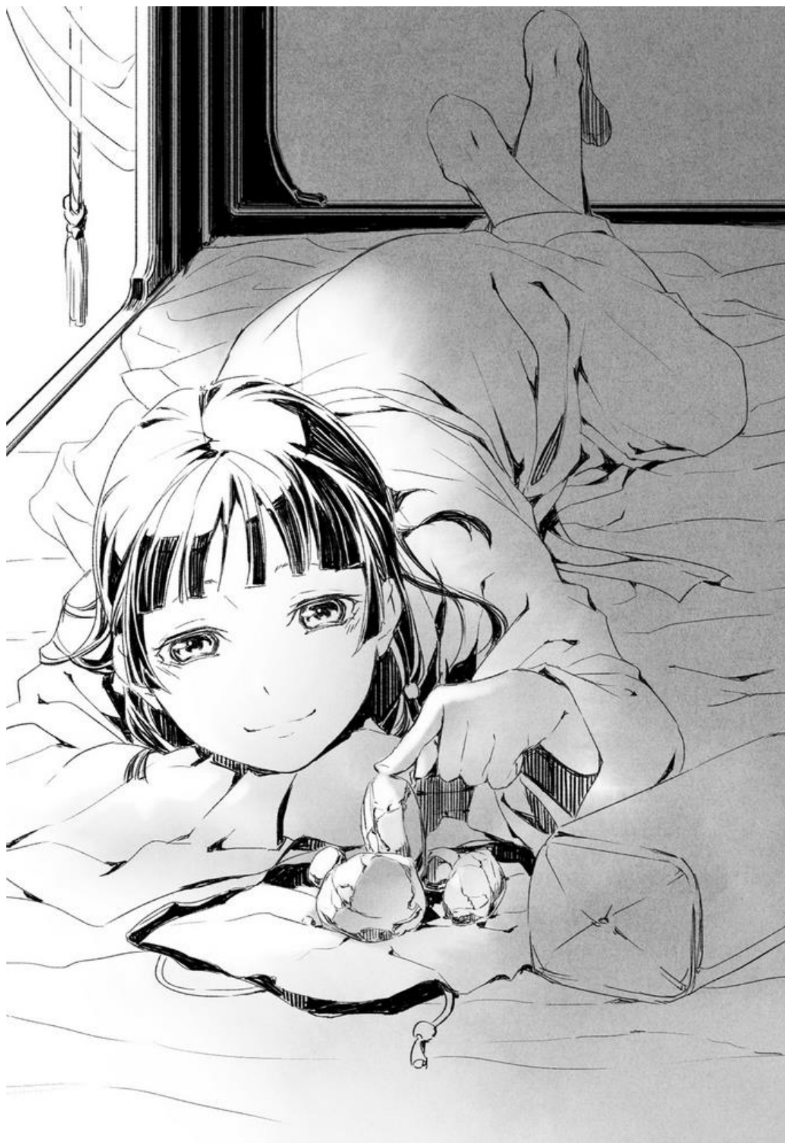
EZ: Maomao en pose Sexy XD